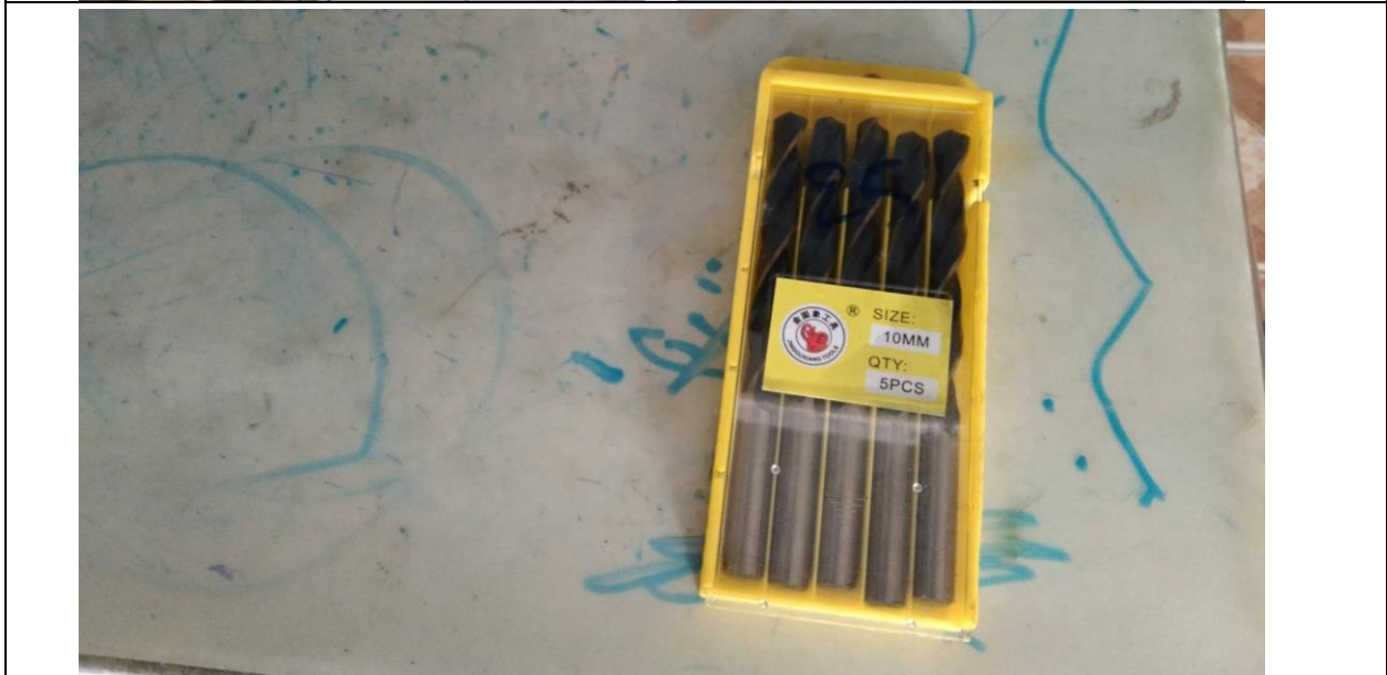
ส่งของให้แผนก Ex Jion